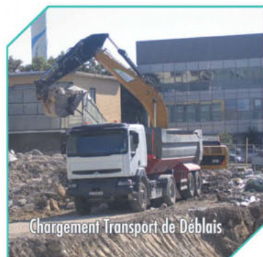
Chargement Transport de Déblais