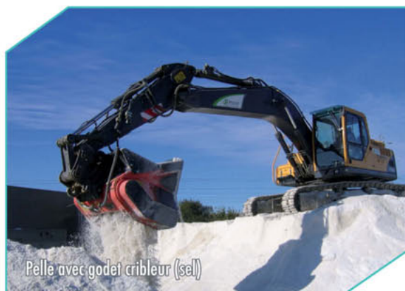
Pelle avec godet cribleur (sel)