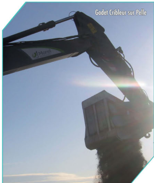
Godet Cribleur sur Pelle